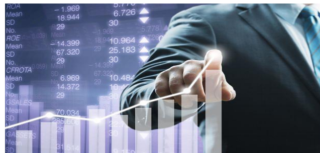
Pandemie und Rohstoffverknappung als Preistreiber

Der Auftragnehmer verlangt die Vergütung von Mehrkosten, die ihm daraus entstanden sind, dass er nach Erhalt des Auftrages die benötigten Materialien nicht mehr zum Preis der Angebotskalkulation beziehen konnte. Die Materialpreise waren während der Ausführung exorbitant gestiegen, sodass sich der Bezugspreis im Vergleich zum kalkulierten Preis um bis zu 100% verändert hat.