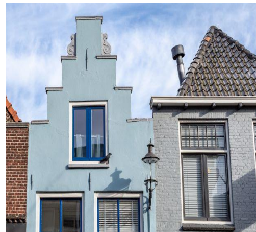
Der Nachbar hat Sonderrechte.

Der BGH (Urteil vom 13.12.2019 - V ZR 152/18) gibt dem Kläger Recht, weil er einen Anspruch auf Beseitigung des bauordnungswidrigen Zustandes (keine eigene Abschlusswand) habe. Die Verletzung nachbarschützender Bauvorschriften führe zu einem verschuldensunabhängigen Beseitigungsanspruch nach § 1004 Abs. 1 Satz 1 BGB analog i.V.m. § 823 Abs. 2 BGB. Die Brandschutzpflichten könne der Beklagte nicht mit der Brandwand auf dem Grundstück des Klägers erfüllen. Auf ein Leistungsverweigerungsrecht gemäß § 275 Abs. 2 BGB wegen der entstehenden hohen Kosten könne sich der Nachbar nicht berufen, weil auf der Seite des Klägers ein Interesse am Schutz von Leib und Leben bestünde.