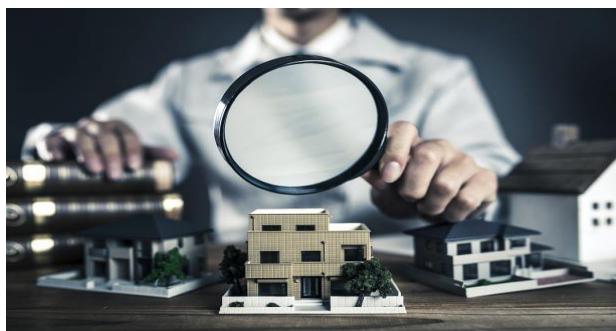
Rolle des Verwalters ist gestärkt

Das alte Recht gewährte dem Verwalter nur einen geringen eigenverantwortlichen Handlungsspielraum, sodass die Wohnungseigentümergeinschaft über nahezu jede Einzelmaßnahme beschließen musste. Der Verwalter ist nun Organ der Wohnungseigentümergeinschaft. Durch die WEG-Reform verfügt der Verwalter über eine weitreichende Vertretungsmacht im Außenverhältnis. Lediglich für Grundstücksgeschäfte und Darlehensverträge fehlt dem Verwalter die originäre Außenvollmacht. Im Innenverhältnis darf der Verwalter nicht nur über dringliche Maßnahmen entscheiden. Er hat auch alle Maßnahmen der laufenden Verwaltung eigenständig zu treffen, soweit diese von untergeordneter Bedeutung sind und nicht zu erheblichen Verpflichtungen führen. Im obigen Beispiel ist zwar der Aufwand von 700 EUR unerheblich. Die Abschaffung eines Spielplatzes dürfte aber für die Wohnungseigentümergeinschaft nicht von untergeordneter Bedeutung sein, sodass hierüber im Innenverhältnis ein Beschluss der Wohnungseigentümergeinschaft hätte gefasst werden müssen.