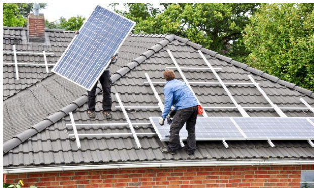
Ausgewogener Ausgleich von Interessen und Kosten ist erreicht.

Wie bisher ist für jede bauliche Änderung ein Beschluss der Wohnungseigentümer erforderlich. Eine Beschlussfassung kann nun unter Berücksichtigung einer Online-Teilnahme erfolgen, wenn diese Möglichkeit - ergänzend zur Präsenzteilnahme - zuvor per Beschluss durch die Wohnungseigentümergeinschaft eröffnet worden ist (§ 23 Abs. 1 WEG). Eine bauliche Änderung kann mit einfacher Stimmenmehrheit beschlossen werden (§ 20 Abs. 1 WEG). Die durch die bauliche Veränderung verursachten Kosten einschließlich der Folgekosten hat grundsätzlich die beschließende Mehrheit zu tragen (§ 21 Abs. 3 S. 1 WEG). Die Kostentragungspflicht weitet sich jedoch auf die überstimmten Wohnungseigentümer aus, soweit sich die Kosten der baulichen Veränderung amortisieren (§ 21 Abs. 2 S. 1 Nr. 2 WEG), was im Beispielfall angenommen werden kann, weil es eine Vermutung der Amortisation gibt, wenn die Kosten innerhalb von zehn Jahren gedeckt sind.